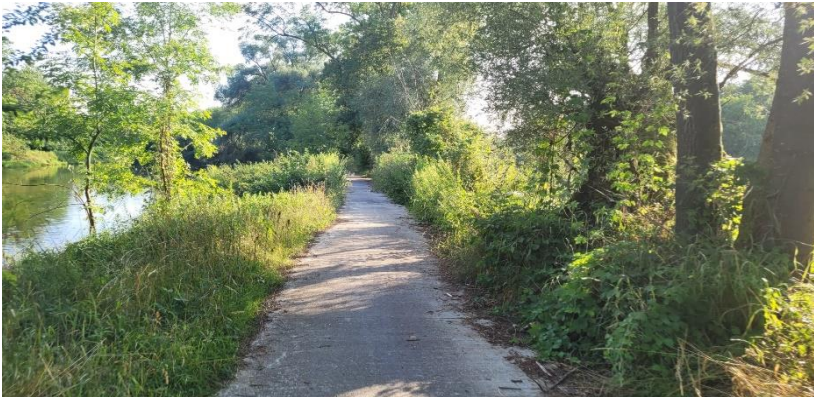
Sachausschuss Jugend, Ehe & Familie

Wir freuen uns auf eine schöne Wanderung mit euch!